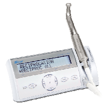
Gerät zur maschinellen Aufbereitung

In Kombination mit der maschinellen Aufbereitung und der Widerstandsmessung zur Längenbestimmung ist es uns heutzutage möglich deutlich bessere Ergebnisse zu erzielen und mehr Zähne langfristig zu erhalten.