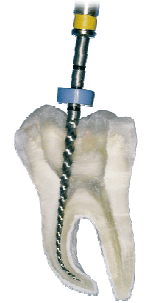
Nickel-Titan-Instrument in gekrümmtem Kanal

Mit den herkömmlichen Wurzelkanalinstrumenten aus Stahl können gekrümmte Wurzelkanäle nur unzureichend aufbereitet werden. Wegen der schlechten Materialeigenschaften ist die Bruchgefahr sehr hoch. Mit neuartigen hochwertigen Nickel-Titan-Instrumenten kann auch bei schwierigen anatomischen Bedingungen eine optimale Aufbereitung erfolgen. Diese Instrumente sind hoch flexibel und können so in gekrümmte Kanäle ohne zu brechen eingeführt werden. (siehe Bild).